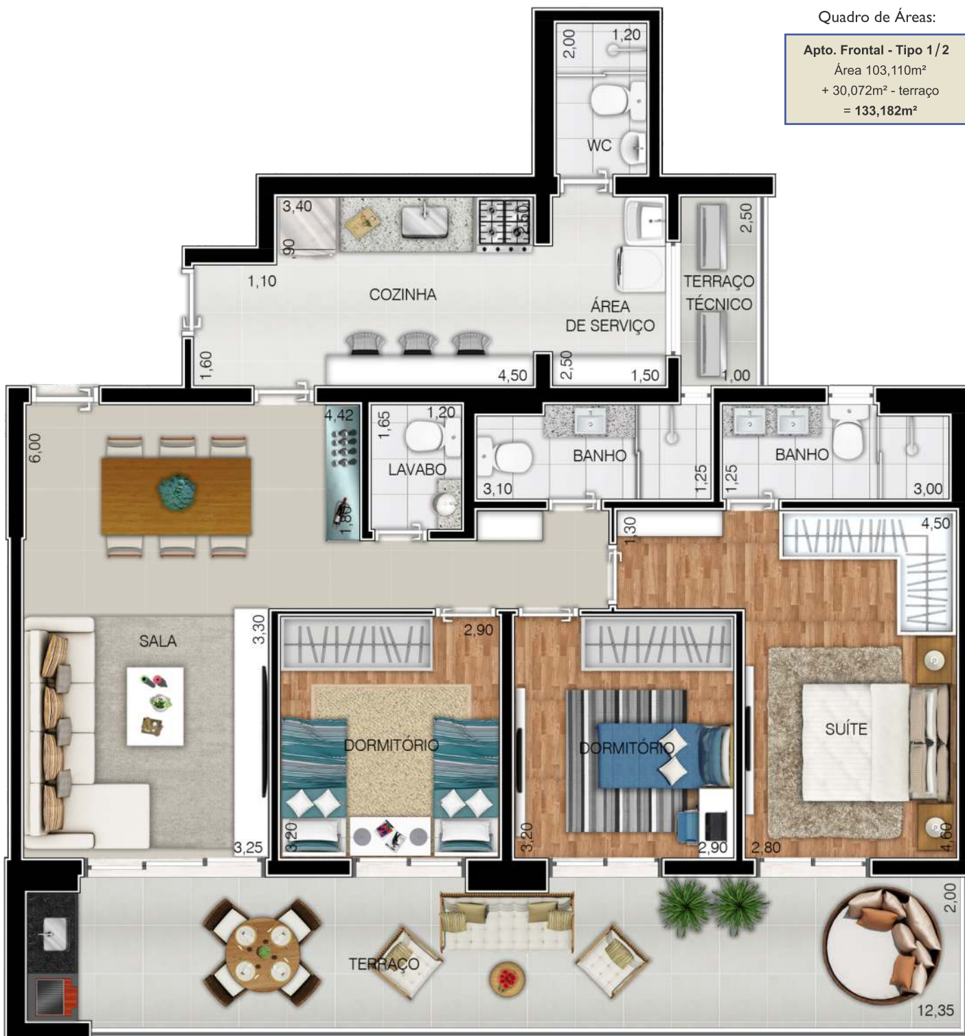
Ilustração artística da planta do apartamento com sugestão de decoração. Os móveis são de dimensões comerciais, não fazendo parte integrante do contrato.

Apto. Frontal - Tipo 1/2 Área 103,110m 2 + 30,072m 2 - terraço = 133,182m 2