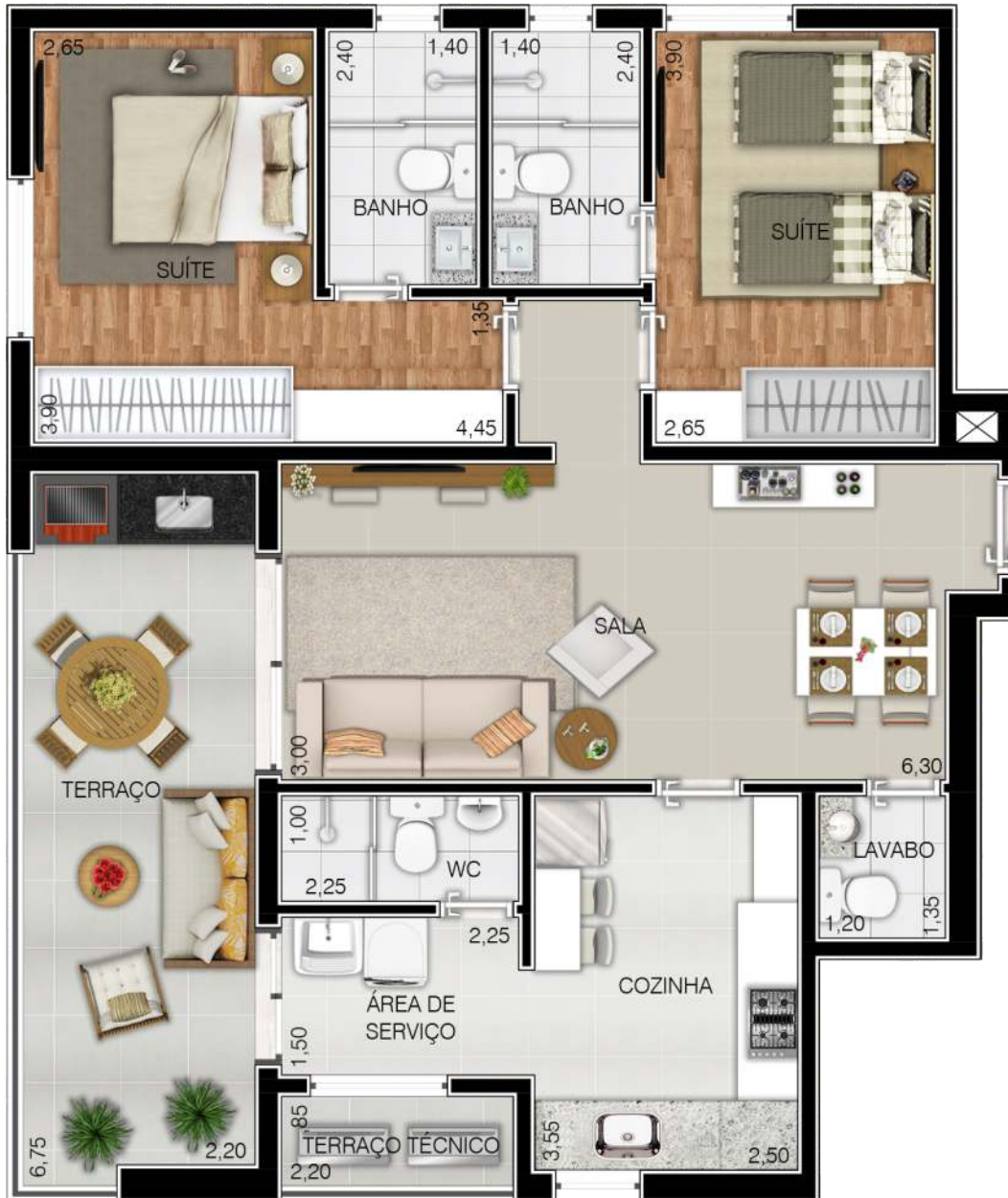
Ilustração artística da planta do apartamento com sugestão de decoração. Os móveis são de dimensões comerciais, não fazendo parte integrante do contrato.

Apto. Lateral - Tipo 3 / 5 Área 81,071m 2 + 18,665m 2 - terraço = 99,736m 2