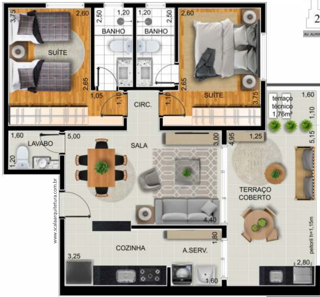
Ilustração artística da planta do apartamento com sugestão de decoração. Os móveis são de dimensões comerciais, não fazendo parte integrante do contrato.